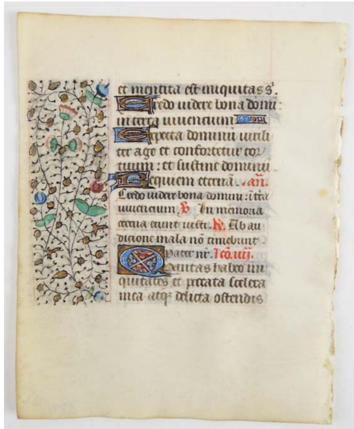
Book of Hours page, circa 1425 - 1450